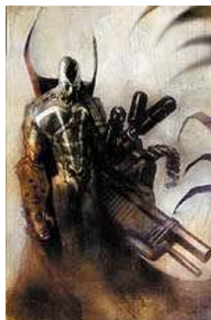
Kuva ja Spawn